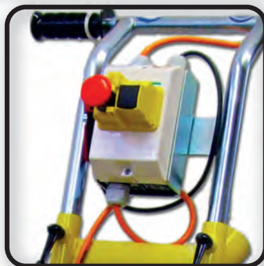
Pour votre sécurité: arrêt d'urgence