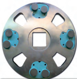
Plateau porte-outils avec segments diamantés pour le ponçage (Grains de 6 à 220 livrables)

Pour le ponçage à sec ou à l'eau des segments avec des liants différents sont livrables