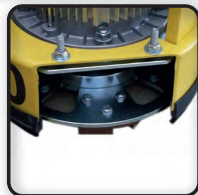
Carter amovible pour le ponçage et le fraisage au ras du mur

Mod. 230 V, recommandé pour bâtiments et travaux à l'intérieur Mod. 400 V, machine efficace pour des surfaces à l'extérieur