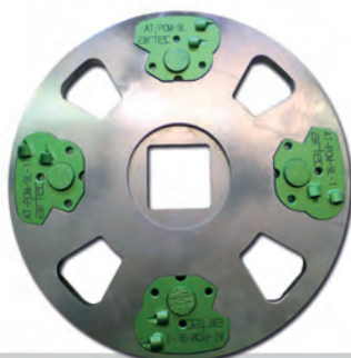
Plateau porte-outils avec segments diamantés (PC)

Pour le ponçage à sec ou à l'eau des segments avec des liants différents sont livrables