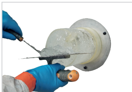
1 - MISE EN PLACE

Installer le tube de carottage, et verser du gel à l'intérieur du tube.