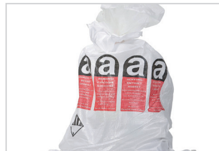
3 - ÉVACUATION

Percer à travers le gel. Les particules sont retenues et confinées dans le gel.