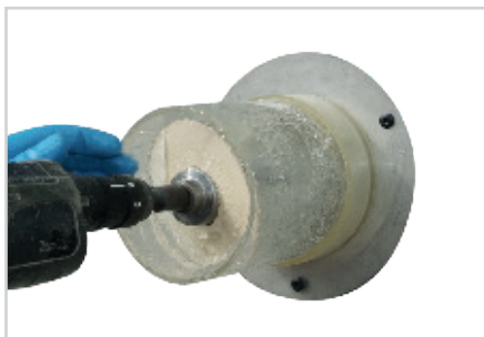
2 - FORAGE

Installer le tube de carottage, et verser du gel à l'intérieur du tube.